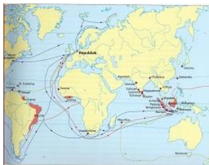
De zeeroutes in de Gouden Eeuw