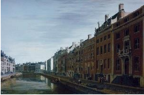
De 'Gouden Bocht' in de Herengracht. Daar woonden de rijkste mensen.