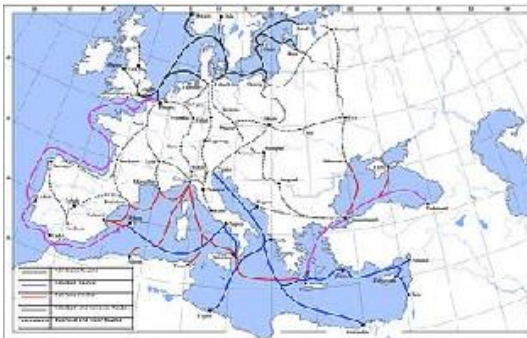
De Nederlanders kwamen overal...

Één reden voor het succes van de Nederlandse economie was dat Nederland op een fantastische plek lag: aan de Noordzee. Je kunt met schepen makkelijk naar het Oosten en terug (bijvoorbeeld naar Zweden, Denemarken en Polen), maar ook naar het Zuiden: naar Spanje en Portugal. De Nederlanders kwamen dus overal, en kochten en verkochten hout, ijzer, vis en graan uit het Noorden en Oosten, en wijn en zout uit het Zuiden. In het begin van de oorlog veroverde 3 Spanje veel land in Nederland, maar later kreeg Nederland weer de controle over het gebied van de rivieren. Via schepen op de Rijn 4 kon Nederland weer handelen met Duitsland.