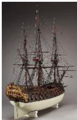
Model van een VOC-schip

De economie was in Nederland ook veel moderner. In andere landen was de adel 11 de baas. Zij verdienden zelf vaak geen geld, maar leefden van het geld dat andere mensen, bijvoorbeeld boeren, voor hen verdienden. De handel vonden ze niet interessant.