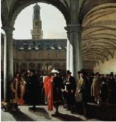
De 'Beurs van Amsterdam'